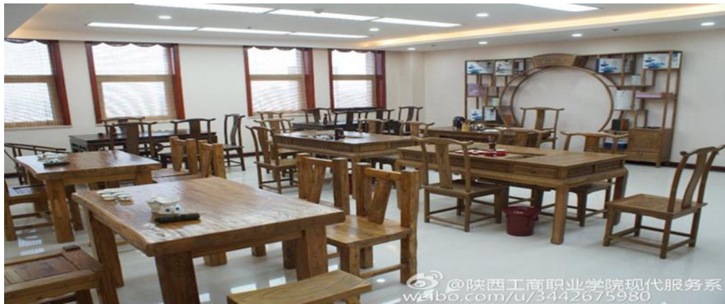
校内茶艺实训室一角

生的实践认知能力，通过顶岗学习，提升本专业的专业素养，强化适应社会发展需要的专门人才。