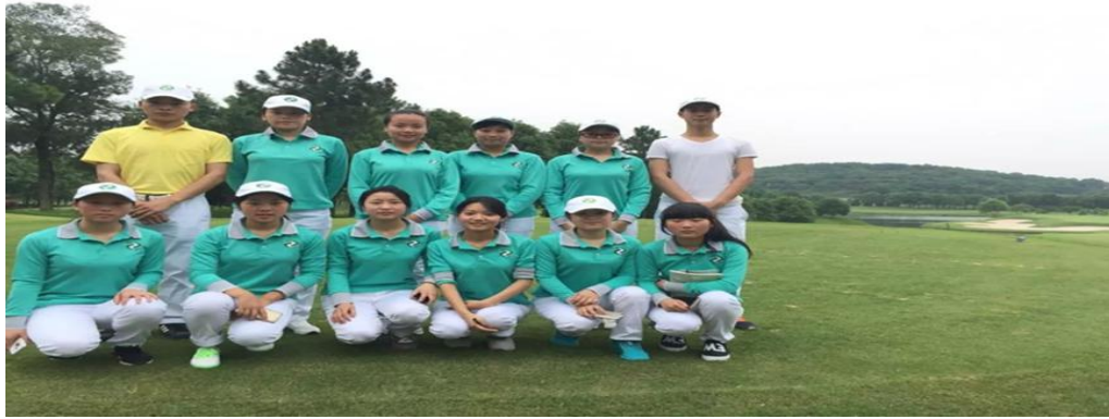
至诚高尔夫俱乐部学生实习风采