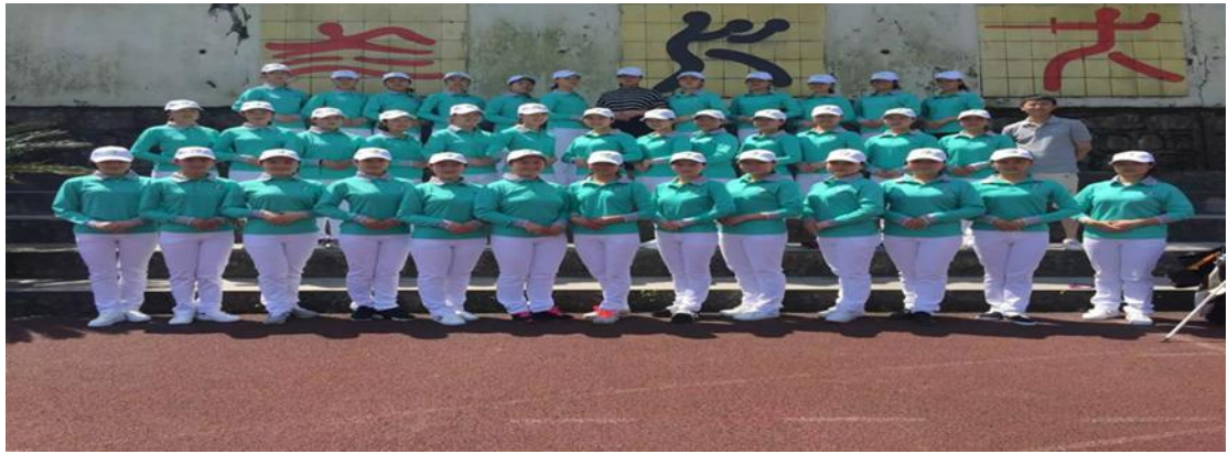
合作企业至诚高尔夫实习生风采展示