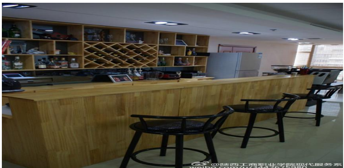
校内咖啡实训室一角