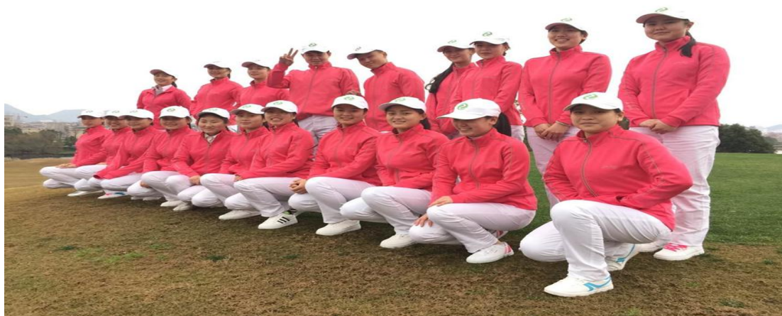
校外学生风采展示

休闲服务与管理专业是我校 2015 年申请获得批准，2016 年开始招生。该专业是陕西省内高职院校唯一一家开始的引领全域旅游新业态，开创全域旅游新风向的新专业。该专业培养的是适应社会主义现代化建设需要，德、智、体、美、劳等全面发展，具备良好的职业素养和敬业精神，熟练掌握休闲服务与管理的职业技能，具有较强的休闲服务、休闲事业的组织策划、休闲市场营销、休闲企业经营与管理的实践能力和专业技能的高端技能型专门人才。