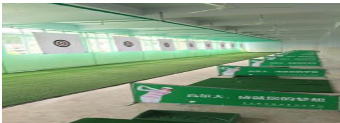
校外高尔夫实训室一角