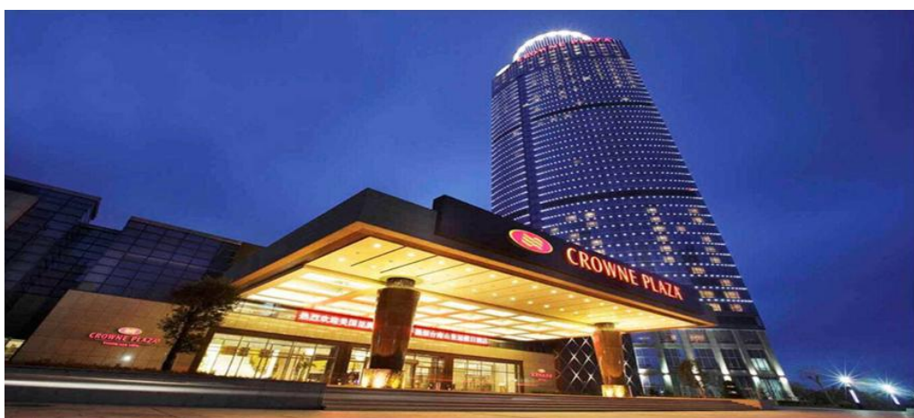
星级酒店（西安皇冠假日酒店）实习场地展示